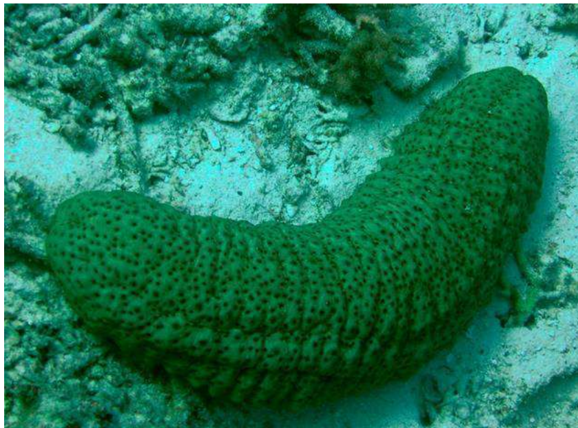
Fig. 3: Oloturia o "cetriolo di mare" 43

Le oloturie sono diffuse in tutti i mari del mondo, con una predilezione per quelli temperati e tropicali. Hanno un elevato valore economico, vengono infatti pescate a scopo alimentare nel Mediterraneo, nelle acque dell'Estremo oriente, nell'Oceano Indiano e nel Pacifico. In alcuni paesi i cetrioli di mare sono considerati delle prelibatezze, in particolare in Cina hanno un prezzo che oscilla tra i 10 e i 600 dollari al chilo, mentre alcune specie particolarmente pregiate possono costare fino a tremila dollari al chilo. Le oloturie vivono dalle zone litoranee fino alle più grandi profondità degli oceani, nascoste nella sabbia melmosa o negli anfratti delle rocce e strisciano sul fondo tra le alghe. Costituiscono il gruppo di detritivori più importanti delle faune delle scogliere ed abissali che possono formare delle popolazioni molto numerose, particolarmente in profondità: costituiscono la metà delle forme viventi a 4.000 metri ed il 90% a 8.000 metri 42 .