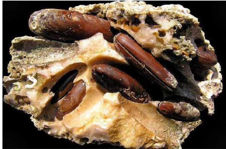
Fig. 2: Lithophaga lithophaga nella roccia in cui cresce 39 .

La foto sotto riportata spiega meglio il fenomeno: